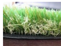
CESPED ARTIFICIAL RIZADO 40MM BICOLOR "GRAN HERMANO 11"